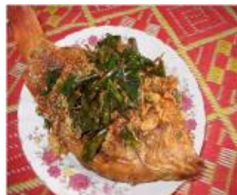
En lækker fisk tilberedt til os af én af fædrene til et AIDS Care barn