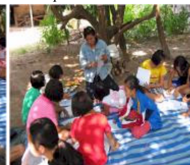
Alle deltager i undervisningen i smågrupperne med stor iver og interesse.