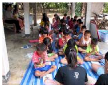
At se en 15 årig pige bede sammen med 39 børn og læse bibelhistorie for dem var imponerende